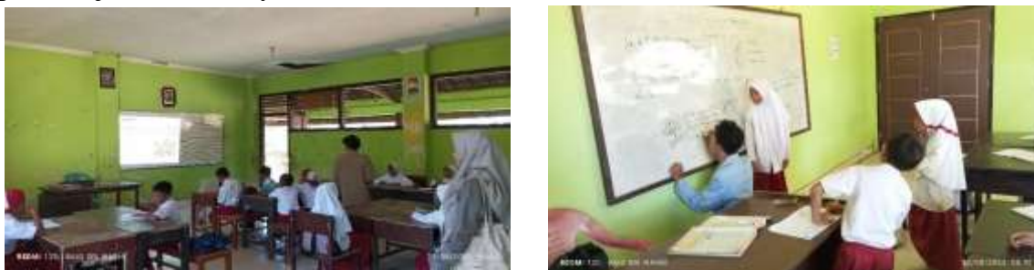
Gambar 1. Kegiatan Teaching assitan

Kegiatan kami lakukan berlima dengan distribusi berkolaborasi dengan guru kelas 4 dan 5. Kegiatan ini kami lakukan dengan perencanaan bersama, pelaksanaan bersama kemudian melakukan refleksi atas praktik mengajar yang telah dilakukan kemudian merancang pembelajaran berikutnya