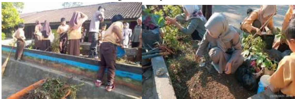
Gambar 5. Kegiatan Peduli Lingkungan

Peduli lingkungan merupakan program yang terdiri dari kegiatan pembersihan lingkungan baik didalam maupun diluar kelas, membuang sampah pada tempatnya, mendaur ulang sampah, serta penataan taman. Program ini bertujuan meningkatkan kesadaran siswa terkait kebersihan. Adapun kegiatan yang dilakukan yakni, pembersihan lingkungan sekolah, membuang sampah pada tempatnya, serta mendaur ulang sampah anorganik. Mengarahkan Semua Murid Membersihkan Ruang Kelas Maupun Di Halaman Kelas.