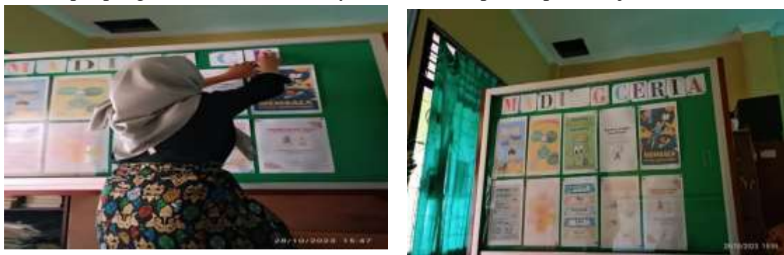
Gambar 4. Revitalisasi Mading

Kegiatan ini kami lakukan agar memancing siswa untuk berkreasi dalam segala hal mulai dari menggambar, membuat puisi dan lain-lain. Tidak jarang mading ini kami gunakan untuk menempel pengetahuan baru atau karya siswa dalam proses pembelajaran.