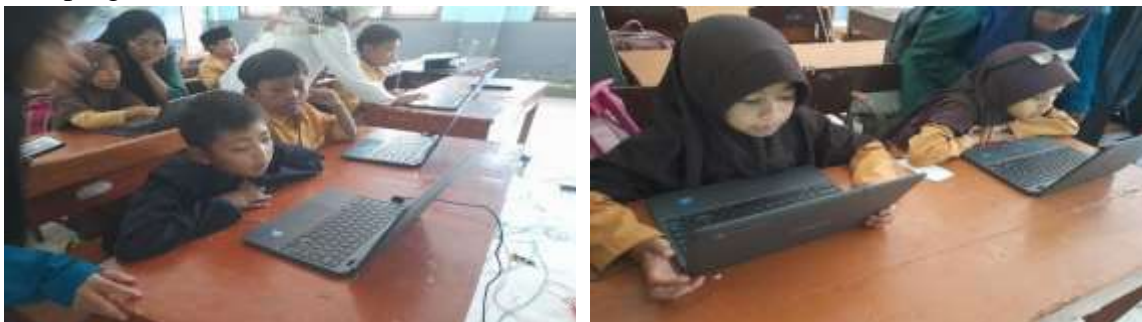
Gambar 7. Assesmen Kompetensi Minimum (AKM)

Program ini merupakan program evaluasi, dimana dilakukan pada awal pengabdian dan di akhir program.