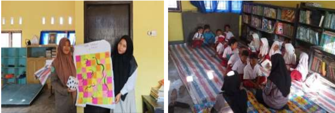
Gambar 6. Privat Numerasi

Program ini kami kelompokkan menjadi dua bagian yaitu siswa berkamampuan tinggi dan rendah, ini kami lakukan agar mudah menentukan pola atau sistem pendampingan yang kami gunakan, demikian pula media yang akan kami gunakan dalam pendampingan. Bagi siswa berkamampuan rendah kami matangkan perhitungan dasar sedangkan siswa yang berkamampuan tinggi kami fokuskan pada kemampuan analisis.