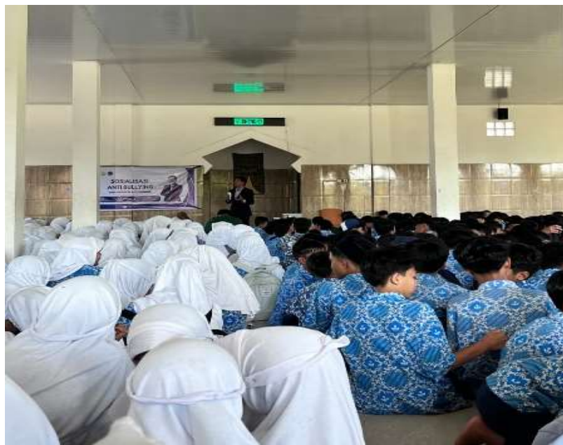
Gambar 2. Penyampaian materi

Selanjutnya, sesi tanya jawab terbuka memberikan ruang bagi siswa untuk menyampaikan pertanyaan, pengalaman pribadi, atau pendapat mereka seputar bullying. Sesi ini menjadi salah satu bagian penting dari kegiatan karena memungkinkan siswa lebih aktif terlibat dan merasa didengarkan. Bahkan siswa yang merasa malu berbicara langsung bisa menyampaikan pertanyaan secara tertulis agar tetap bisa berpartisipasi.