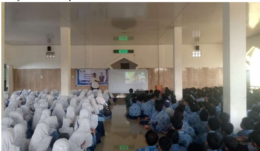
Gambar 1. Penayangan video edukatif

Kegiatan awal dimulai dari Pemutaran video edukatif , yang berfungsi untuk membangun empati siswa/i SMP N 1 Sakra terhadap korban bullying. Melalui visualisasi yang menggugah, siswa diharapkan dapat lebih memahami bagaimana perasaan korban dan pentingnya mencegah tindakan tersebut sejak awal. Video ini juga menjadi pengantar yang efektif menuju sesi berikutnya.