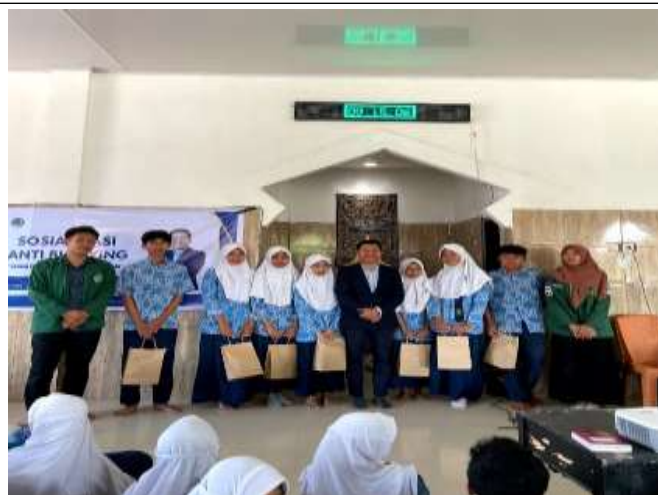
Gambar 4. Kuis interaktif dan reward

Dalam pelaksanaan program sosialisasi anti bullying ini ada beberapa faktor pendukung dan penghambat kelancaran kegiatan yakni: