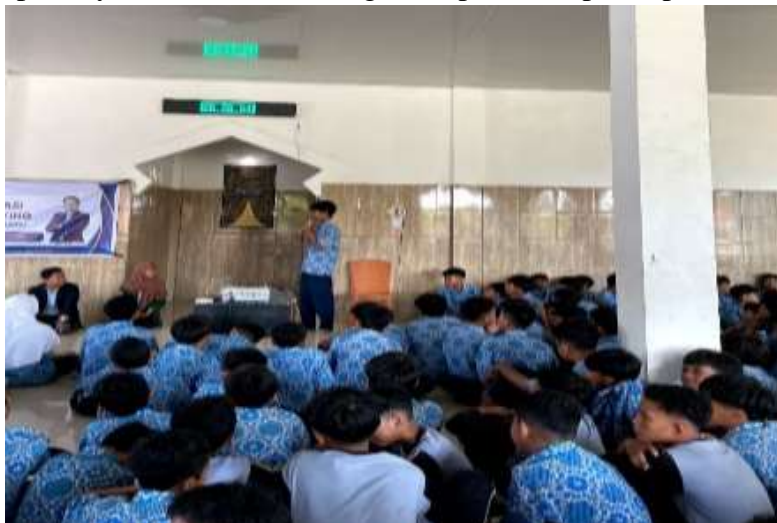
Gambar 3. Sesi tanya jawab

Selanjutnya, sesi tanya jawab terbuka memberikan ruang bagi siswa untuk menyampaikan pertanyaan, pengalaman pribadi, atau pendapat mereka seputar bullying. Sesi ini menjadi salah satu bagian penting dari kegiatan karena memungkinkan siswa lebih aktif terlibat dan merasa didengarkan. Bahkan siswa yang merasa malu berbicara langsung bisa menyampaikan pertanyaan secara tertulis agar tetap bisa berpartisipasi.