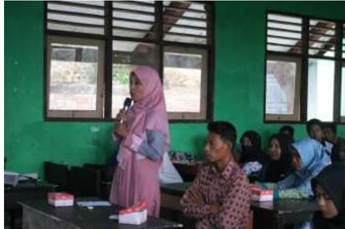
Gambar 6. Salah Satu Guru Presentasi Pembelajaran dan Asesmen yang Sudah di Kerjakan

terdapat beberapa pembelajaran wajib, termasuk pembelajaran matematika, dengan alokasi waktu tetap 180 jam pertahun seperti pada kurikulum 2013. Namun, ada perubahan dalam pelaksanaan antara kurikulum 2013 dan kurikulum Merdeka Mengajar. Pada kurikulum 2013, pembelajaran reguler dan proyek merupakan dua hal terpisah dan dilaksanakan secara mandiri. Sementara itu, pada kurikulum Merdeka Mengajar, pembelajaran reguler dan pembelajaran proyek diintegrasikan menjadi satu kesatuan dan dilaksanakan melalui sistem blok.