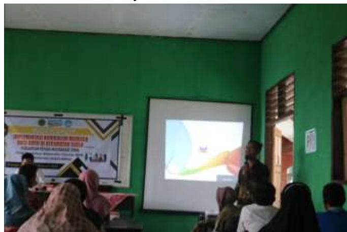
Gambar 5. Presentasi Materi

Penyusunan modul ajar kurikulum Merdeka Belajar dengan penyusunan Rencana Pembelajaran (RPP) pada Kurikulum 2013 adalah sebuah rencana pengorganisasian pembelajaran yang bertujuan untuk mencapai kompetensi dasar yang telah ditetapkan dalam standar isi dan dijabarkan dalam silabus. Perubahan yang terjadi dalam penyusunan modul ajar ini lebih berkaitan dengan istilah yang digunakan, namun tidak memiliki perbedaan yang signifikan dengan pendekatan sebelumnya.