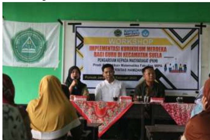
Gambar 3. Pembukaan