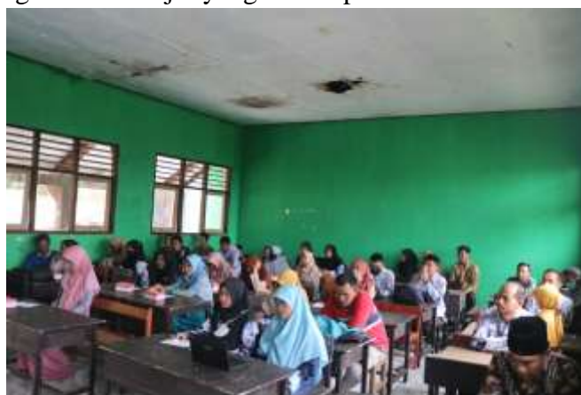
Gambar 4. Peserta dari 3 SMPN Satu Atap 2 di Kecamatan Suela

Dengan memperhatikan kriteria-kriteria tersebut, guru dapat merancang atau memodifikasi modul ajar yang sesuai dengan kebutuhan dan karakteristik siswa mereka. Pengembangan modul kurikulum merdeka belajar yang mengikuti kriteria ini diharapkan akan memberikan pengalaman belajar yang lebih optimal dan bermanfaat bagi siswa.