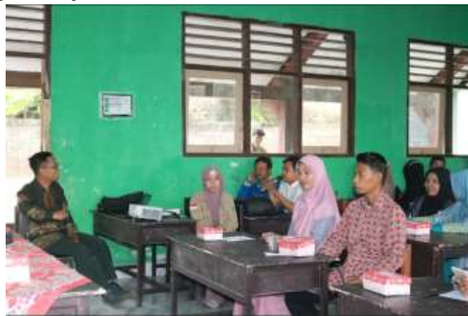
Gambar 7. Salah Satu Guru Memberikan Tanggapan dan Pertanyaan Kepada Guru yang Presentasi

Selain itu, pembelajaran proyek juga dipisahkan dari pembelajaran reguler dalam kurikulum Merdeka Mengajar. Pembelajaran proyek memiliki keberlanjutan dan fokus tersendiri dalam kurikulum ini. Penilaian asesmen pada proyek dilakukan oleh guru sesuai dengan minat dan kemampuan peserta didik. Hal ini memberikan pendekatan penilaian yang lebih personal dan mempertimbangkan potensi serta perkembangan unik setiap siswa. Dengan perubahan-perubahan ini, diharapkan kurikulum SMP Program Merdeka Mengajar dapat memberikan pengalaman pembelajaran yang lebih bermakna dan relevan, serta mendorong kreativitas dan kemampuan berpikir kritis siswa melalui beragam dan menariknya proyek pembelajaran