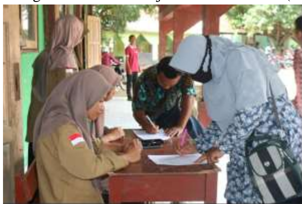
Gambar 2. Reristrasi Peserta

Kesimpulannya, hasil analisis data angket menunjukkan bahwa peserta menganggap workshop sebagai kegiatan yang bermanfaat, namun mayoritas peserta merasa belum berpengalaman dalam menyusun perangkat pembelajaran sesuai kurikulum merdeka. Oleh karena itu, penting untuk memberikan tindak lanjut atau pelatihan lanjutan guna mendukung implementasi kurikulum merdeka di sekolah. Kurikulum Merdeka Belajar merupakan suatu kurikulum yang menekankan pembelajaran intrakurikuler yang beragam, sehingga konten pembelajaran lebih optimal dengan waktu yang cukup untuk mendalami konsep dan kompetensi yang sesuai dengan kebutuhan belajar dan minat siswa (Dewi: 2022).