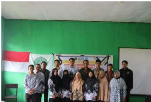
Gambar 8. Dokumentasi dengan Peserta dari 3 SMPN Satu Atap di Kecamatan Suela

pada tujuan Sistem Pendidikan Nasional dan Standar Nasional Pendidikan. Namun, terdapat perbedaan signifikan di antara keduanya. Kurikulum Merdeka dikembangkan dengan mengutamakan profil pelajar Pancasila pada siswa. Sementara itu, pada kurikulum 2013, kompetensi yang dituju berupa kompetensi dasar yang diorganisir pertahun dalam empat kompetensi inti, yang dinyatakan dalam bentuk poin-poin dan terdapat pada mata pelajaran Pendidikan Agama dan Budi Pekerti serta Pendidikan Pancasila dan Kewarganegaraan.